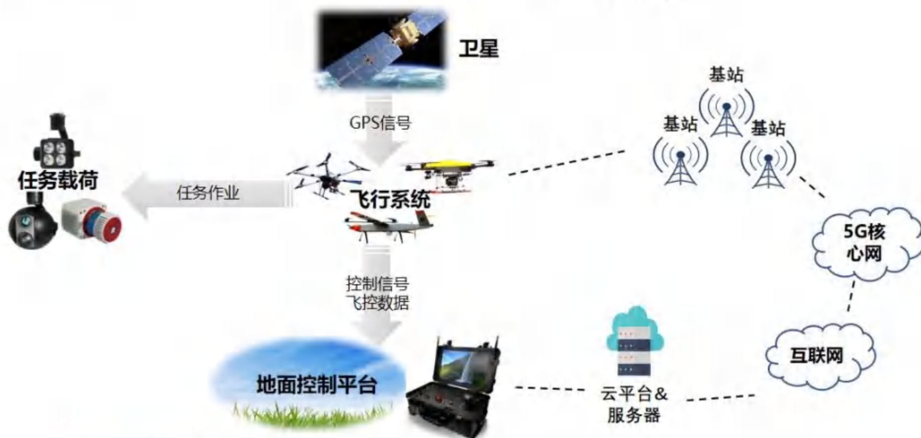
图 1 网联无人机系统架构

网联无人机受到信息安全攻击与其系统架构有关。作为一个集传感器、控制器、通讯设备、业务载荷装置于一体、高度集成的信息物理系统，无人机系统架构与工业控制系统架构具有极高的相似性。网联无人机系统是指网联无人机及其配套的六大部分组成，包括飞行控制系统、通信导航系统、机载终端、任务载荷以及安全飞行管理系统。各系统间架构如下图：